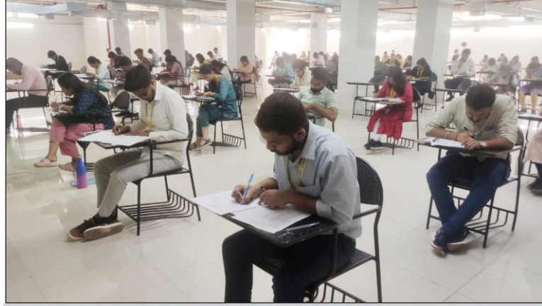
परीक्षा में प्रतिभाग करते विद्यार्थी

दिनांक 15 अप्रैल, 2024 को विश्वविद्यालय के अंतर्गत महायोगी गोरखनाथ संचालित गुरु गोरक्षनाथ