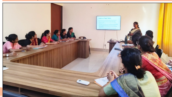
मेंटर ट्रेनिंग मीटिंग के दौरान शिक्षिकाएं