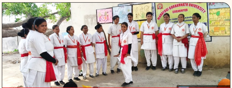
07 नुककड़ नाटक के दौरान नर्सिंग की छात्राएं