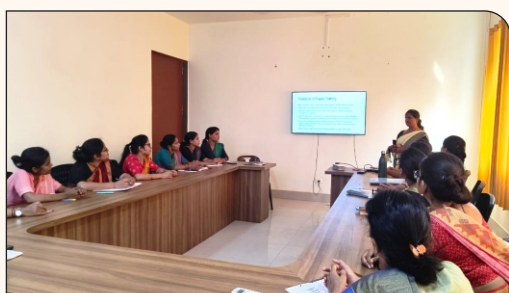
05 मेंटर ट्रेनिंग मीटिंग में उपस्थित नर्सिंग कॉलेज की शिक्षिकाएं