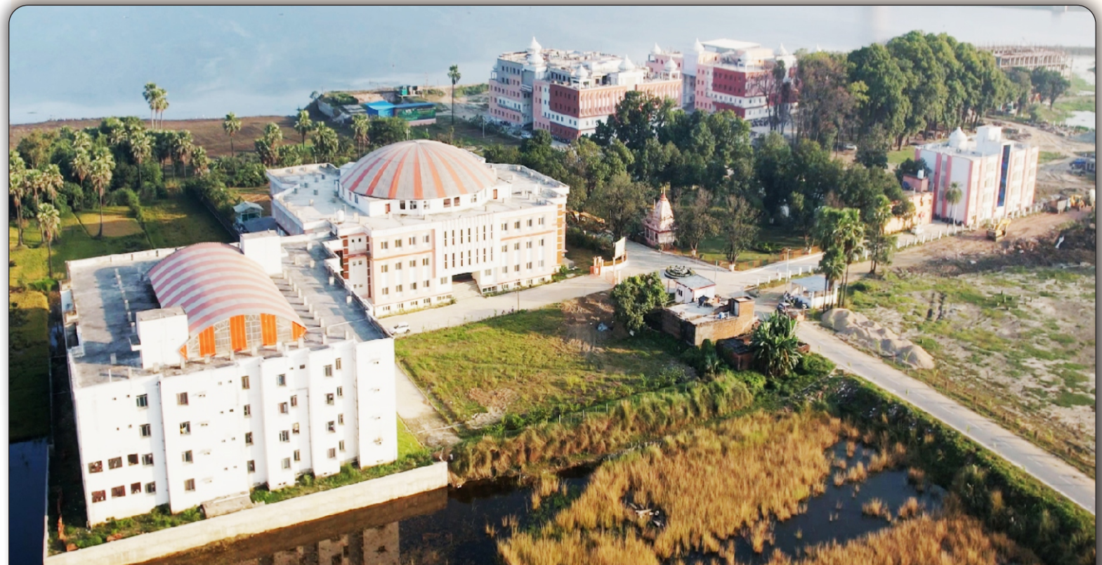
05 विश्वविद्यालय परिसर का वायवीय दृश्य