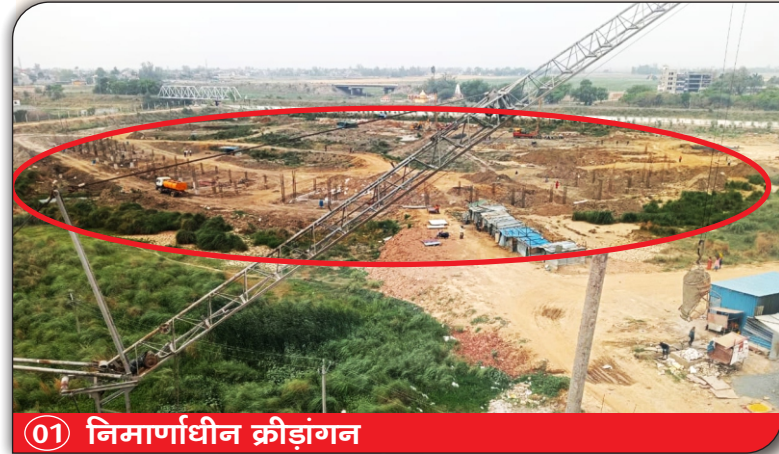
01 निर्माणाधीन क्रीडांगन