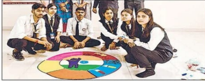
बुधवार को महायोगी गोरखनाथ विश्वविद्यालय में मतदाता जागरूकता अभियान के तहत आयोजित प्रतियोगिता में रंगोली बनाते छात्र। • हिन्दुस्तान

'चलो मतदान करें' और 'वोट फॉर श्योर' पर केंद्रित रंगोली प्रतियोगिता में सभी विभागों से दो दर्जन से ज्यादा प्रतिभागियों ने प्रतिभाग किया।