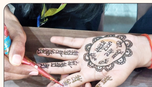
06 मेंहदी प्रतियोगिता के दौरान छात्राएं