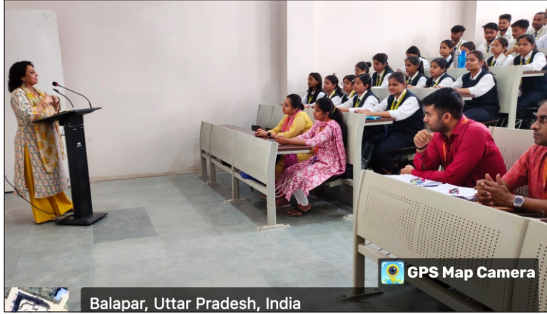
Balapar, Uttar Pradesh, India