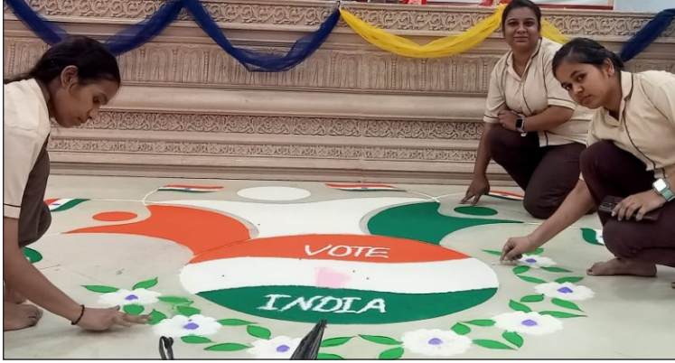
रंगोली बनाती हुई छात्राएं

दिनांक 10 अप्रैल, 2024। महायोगी गोरखनाथ विश्वविद्यालय गोरखपुर में मतदाता जागरूकता अभियान के अंतर्गत रंगोली प्रतियोगिता का आयोजन आयुर्वेद कॉलेज के प्रार्थना सभागार में हुआ। मतदाता जागरूकता अभियान के द्वितीय चरण में रंगोली प्रतियोगिता में रंग अबीर गुलाल से लोकतंत्र की अद्भुत आकृति ने युवा मतदाताओं को आकर्षित किया। चलो मतदान करे और वोट फॉर श्योर और स्वच्छता अभियान पर केंद्रित रंगोली प्रतियोगिता में सभी विभागों से दो दर्जन से ज्यादा प्रतिभागियों