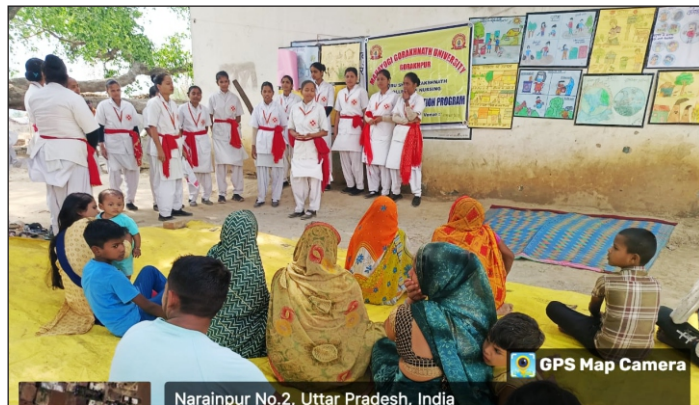
पर्यावरण स्वच्छता पर जागरूक करतीं हुई छात्राएं