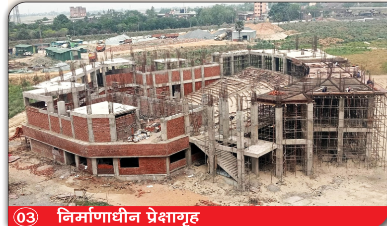
03 निर्माणाधीन प्रेक्षागृह