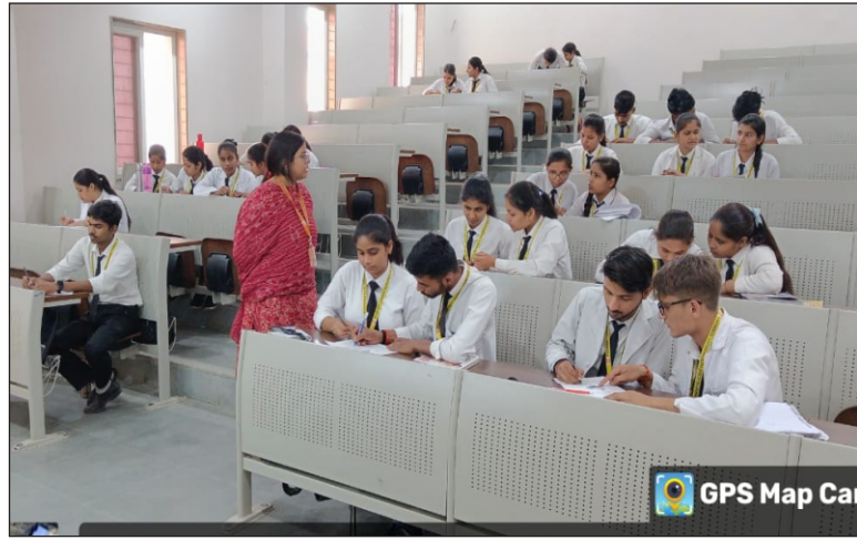
GPS Map Call

दिनांक 25 अप्रैल, 2024 को महायोगी गोरखानाथ विश्वविद्यालय गोरखपुर के अंतर्गत संचालित संबद्ध स्वास्थ्य विज्ञान संकाय के माइक्रो बायोलॉजी विभाग में विश्व मलेरिया दिवस पर एक परिचर्चा कार्यक्रम का आयोजन किया गया।