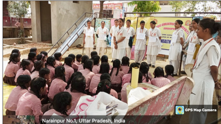
स्वास्थ्य के प्रति जागरूक करती हुई नर्सिंग कॉलेज की छात्राएं