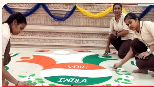
04 रंगोली बनाती छात्राएं