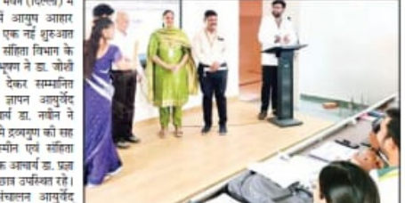
कार्यक्रम का संचालन आयुर्वेद