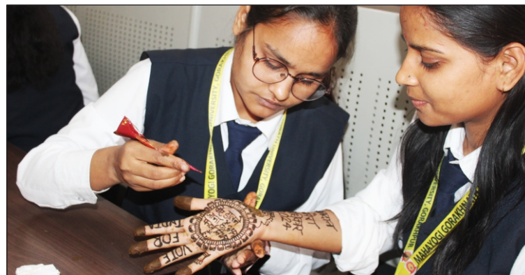
मतदाता जागरूकता के द्वितीय चरण के मेंहदी प्रतियोगिता में प्रतिभाग करती छात्राएं

दिनांक 05 अप्रैल, 2024 को महायोगी गोरखनाथ विश्वविद्यालय गोरखपुर में भारत सरकार निर्वाचन आयोग एवं उच्च शिक्षा विभाग द्वारा निर्देशित मतदाता जागरूकता अभियान के द्वितीय चरण में मेंहदी प्रतियोगिता में लोकतंत्र के विविध विषय चटक हुए। मेंहदी की लालिमा में चलो मतदान करे और वोट फॉर श्योर को केंद्रित कर छात्र-छात्राओं ने मेंहदी से लोकतंत्र की अभिव्यक्ति को सशक्त करने का संकल्प लिया। मेंहदी के चटक रंगों में लोकतंत्र की लालिमा विविध आकृति और अक्षरों से उतर कर निखर गया।