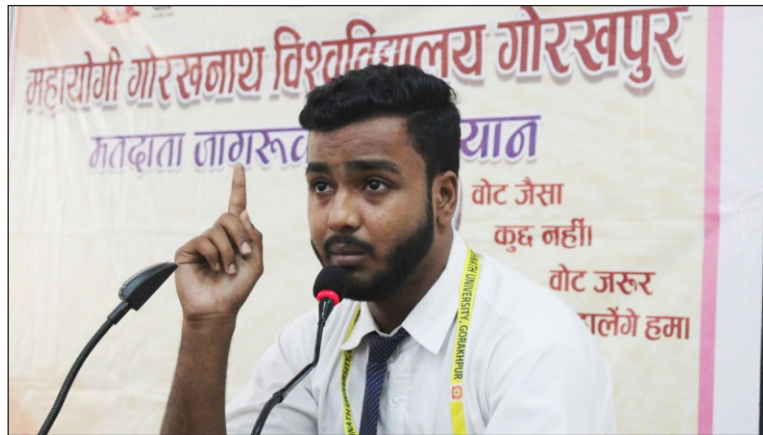
मतदाता जागरूकता अभियान में सम्बोधित करता विद्यार्थी