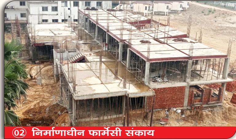
02 निर्माणाधीन फार्मसी संकाय