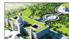
ही छात्रावास का आवंटन किया जाएगा।