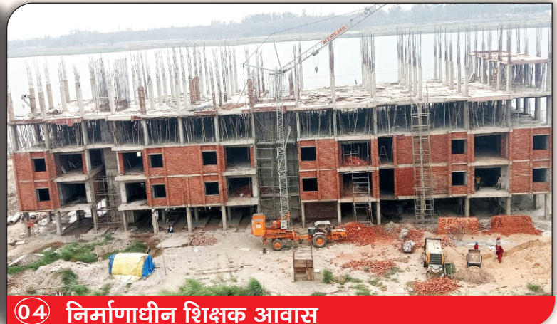
04 निर्माणाधीन शिक्षक आवास